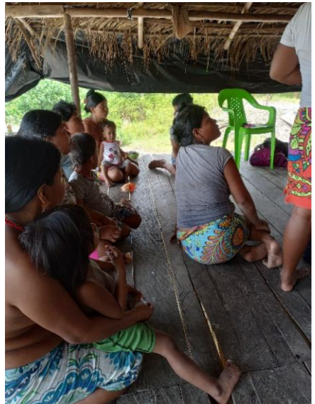
Jornada de salud en San Pablo Adentro

de salud después de eso. Vemos en este tipo de servicio una buena oportunidad para seguir trabajando con varias comunidades, incluyendo algunas donde no hemos podido llegar aún.