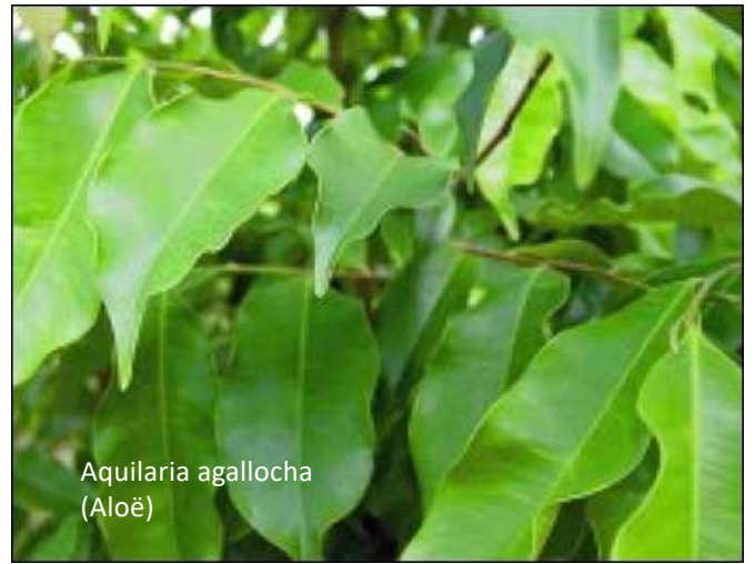
Aquilaria agallocha (Aloë)

gomhars oogsten. In uitzonderlijke gevallen – bij zeer hoge temperaturen in de woestijn – kan men de vanzelf vloeiende mirre oogsten (de heilige zalfolie in Ex. 30:23).