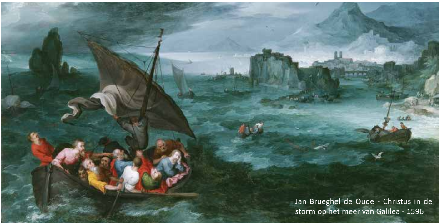
Jan Brueghel de Oude - Christus in de storm op het meer van Galilea - 1596

Beste lezers, wat een Heiland hebben wij. Hij komt naar u toe, en naar mij toe en Hij steekt Zijn hand uit. Hij zegt: Ik bewaar je, Ik ga met je mee, de hele dag. Voor de één is het zus, voor de ander zijn de golven zo. Wind en golven hebben we in ons hele leven, en soms is het moeilijk om almaar naar boven te kijken. Maar ik zeg het heel dikwijls tegen mezelf: Je moet naar boven kijken, dan heb je vrede en blijdschap. Dan ben je dankbaar, want dan zie je de Meester. Hij pakt je bij de hand en laat je over de golven heen wandelen met een rustig gemoed. Wat een Heer hebben wij; en in de psalm die we hebben gelezen, wordt dat eigenlijk verwoord. Er is nog een andere geschiedenis, waarin de Heer in de storm rustig