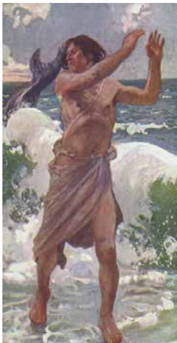
Jona door James Tissot

En in het binnenste van de vis bleef Jona drie dagen en drie nachten in leven. Wat moet er dan in je omgaan? Als je misschien door die vis wordt doodgebeten, dat zou kunnen natuurlijk, dan ben je er ook niet meer. Maar hij kwam levend in het binnenste van die vis, het wordt hier duidelijk omschreven en hij bleef daar drie dagen en drie nachten. Het doet ons denken aan de Heere Jezus, Die drie dagen en drie nachten in het graf geweest is. Drie dagen in het binnenste van de vis. Je zou zeggen: Er is geen zuurstof, en je hebt geen eten. Maar de Heere zal er toch voor gezorgd hebben, want Hij bestuurt ons lot. En dat doet Hij nu ook nog. Hij gaf die vis drie dagen later ook opdracht om Jona uit te spuwen op het droge.